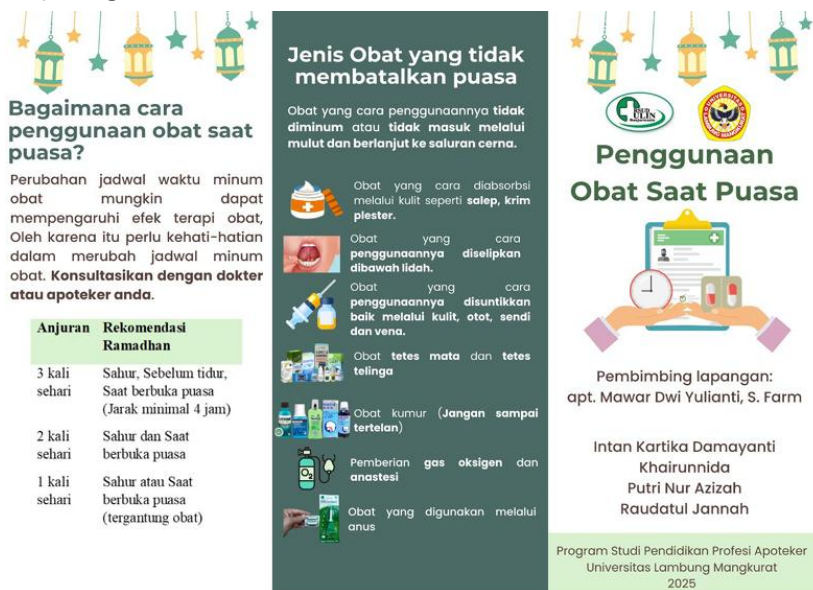
Gambar 1. Leaflet Penggunaan Obat Selama Berpuasa (tampak depan)

Persiapan promosi kesehatan dilakukan dengan membuat media PowerPoint dan leaflet. Leaflet merupakan media kertas sederhana sehingga mudah dilipat dan dibawa serta dapat menyampaikan informasi pesan secara ringkas (Anugrah et al., 2024). Kedua media tersebut dipilih agar peserta lebih tertarik untuk mendengarkan informasi yang akan diberikan. Leaflet yang digunakan berisi materi sebagai terkait: 1) Jenis obat yang tidak membatalkan puasa; 2) Cara menggunakan obat selama berpuasa dengan frekuensi 1 kali sehari sampai dengan 4 kali sehari; 3) Jadwal penggunaan obat serta penjelasan bagaimana konsumsi obat saat makan, sesudah makan, dan sebelum makan saat menjalankan ibadah berpuasa; dan 4) Rekomendasi penggunaan obat ataupun suplemen saat menjalankan ibadah puasa. Leaflet yang di gunakan dapat dilihat pada gambar 1 dan 2.