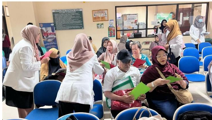
Gambar 5. Proses pretest edukasi “cara penggunaan obat selama berpuasa”

Berdasarkan hasil pretest yang diberikan kepada 22 peserta, seluruh responden berhasil menjawab pertanyaan pertama dengan benar. Pada pertanyaan kedua, sebanyak 20 peserta (90,90%) memberikan jawaban yang tepat, sedangkan pada pertanyaan ketiga hanya 15 peserta (68,16%) yang menjawab dengan benar. Proses pretest edukasi cara penggunaan obat selama berpuasa dapat dilihat pada gambar 5.