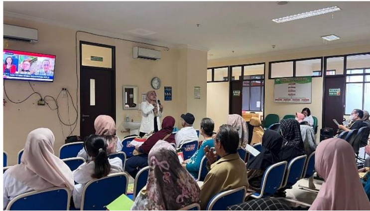
Gambar 6. Proses Edukasi "Cara Penggunaan Obat Selama berpuasa"

memiliki kebingungan. Pemateri tidak hanya menjawab pertanyaan peserta, tetapi juga mengajukan pertanyaan balik guna memastikan bahwa materi yang disampaikan benar-benar dipahami sehingga proses edukasi berlangsung secara interaktif antara pemateri dan peserta. Proses edukasi cara penggunaan obat selama berpuasa dapat dilihat pada gambar 6.