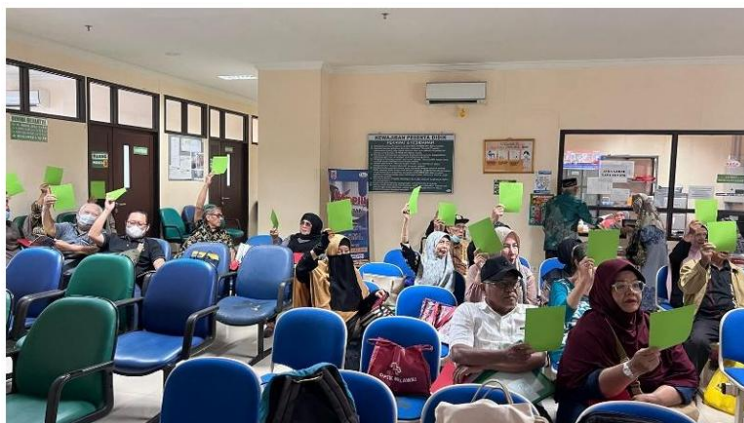
Gambar 8. Proses Edukasi “Cara Penggunaan Obat Selama Berpuasa”

Berdasarkan hasil posttest dengan menggunakan pertanyaan yang sama seperti pada pretest , terlihat adanya peningkatan pemahaman peserta terhadap materi promosi kesehatan yang telah disampaikan. Pada pertanyaan pertama (Gambar 7), seluruh responden berhasil menjawab dengan benar, yang menunjukkan bahwa peserta telah memahami bahwa “Obat yang tidak masuk melalui mulut tidak membatalkan puasa”. Sementara itu, hasil posttest pada pertanyaan kedua (Gambar 7) menunjukkan adanya peningkatan jumlah peserta yang menjawab dengan benar. Sebelumnya, saat pretest hanya 20 responden (90,90%) menjawab dengan tepat, namun setelah sesi edukasi, seluruh peserta atau 22 responden (100%) mampu menjawab dengan benar. Selanjutnya, untuk pertanyaan ketiga (Gambar 7) jumlah responden yang menjawab dengan tepat meningkat dari 15 orang (68,16%) saat pretest menjadi seluruh peserta atau 22 orang (100%) pada posttest . Peningkatan ini mencerminkan keberhasilan peserta dalam memahami materi setelah mengikuti sesi edukasi. Secara keseluruhan, hasil posttest menunjukkan bahwa peserta telah memiliki pemahaman yang baik mengenai penggunaan obat selama berpuasa. Kenaikan nilai ini menjadi indikator bahwa tujuan dari kegiatan promosi kesehatan telah tercapai, khususnya dalam meningkatkan pemahaman peserta. Proses posttest edukasi cara penggunaan obat selama berpuasa dapat dilihat pada gambar 8.