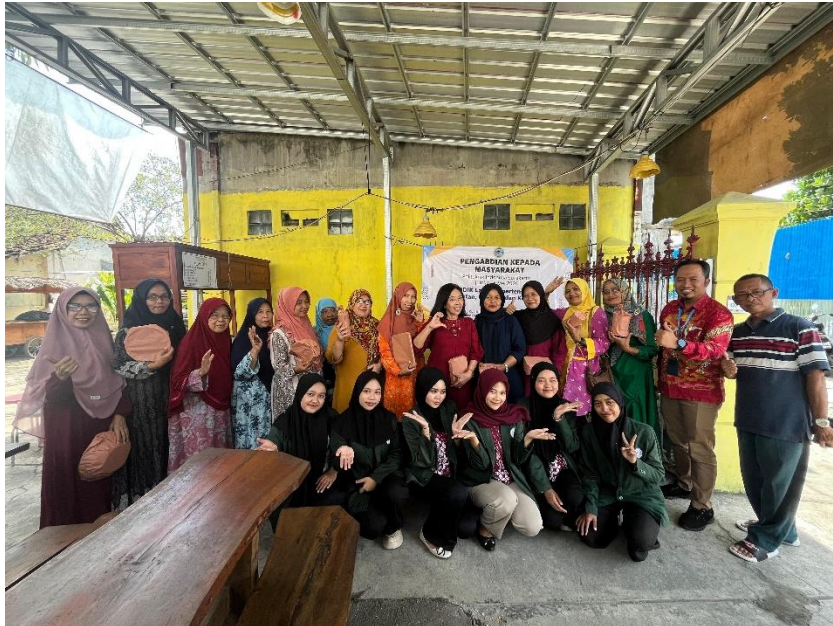
Gambar 3. Diskusi dan Pendampingan Antihypertensi

Kegiatan penyuluhan dimulai pada pukul 09.00 WIB. Kegiatan penyuluhan dilaksanakan di PKK Posyandu RT.03/RW.02 Kelurahan Bumi, Kecamatan Laweyan, Surakarta tentang materi CERDIK Lawan Hipertensi: Cek Kesehatan, Edukasi, dan Konseling tentang anti hipertensi.