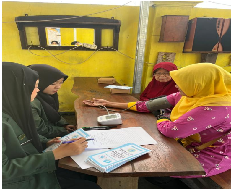
Gambar 1. Cek Kesehatan bagi warga masyarakat

sebaik mungkin agar tidak monoton. Kegiatan sosialisasi ini dilaksanakan oleh Program D3 Farmasi Politeknik Indonusa Surakarta bekerjasama dengan Posyandu RT.03/RW.02 Kelurahan Bumi, Kecamatan Laweyan, Surakarta. Acara ini berlangsung selama satu hari dan diikuti oleh 25 masyarakat. Kegiatan ini bertujuan untuk memperkenalkan CERDIK Lawan Hipertensi: Cek Kesehatan, Edukasi, dan Konseling Obat Bagi Ibu – Ibu PKK Posyandu RT.03/RW.02 Kelurahan Bumi, Kecamatan Laweyan, Surakarta yang baik.