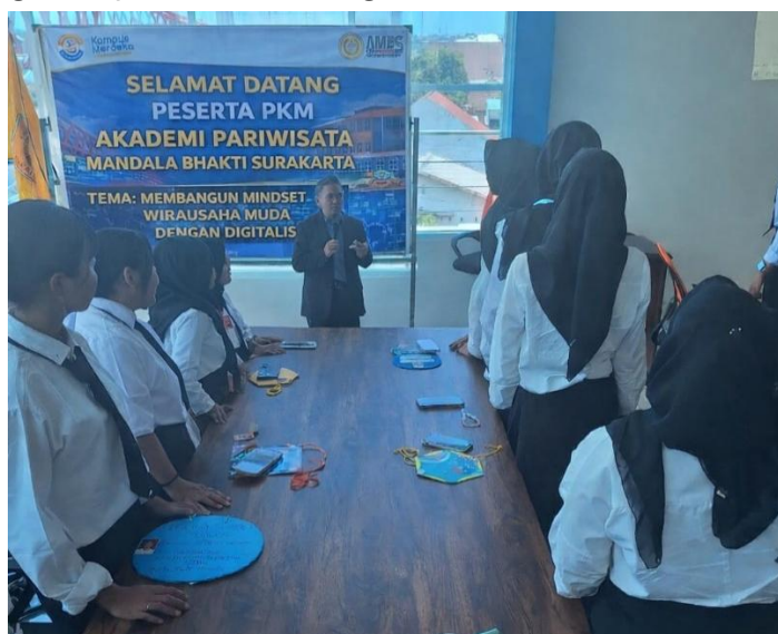
Gambar 2. Model Pelatihan

Setelah pelaksanaan pelatihan, hasil post-test menunjukkan adanya peningkatan yang signifikan dalam pemahaman mahasiswa terkait konsep kewirausahaan digital dengan nilai rata-rata mencapai 80,3. Mahasiswa mulai mampu mengidentifikasi peluang usaha digital di bidang pariwisata, memahami peran teknologi digital dalam pemasaran dan pengelolaan usaha, serta menunjukkan kesiapan awal dalam merancang ide bisnis berbasis teknologi. Peningkatan ini mencerminkan bahwa materi dan metode pelatihan yang diberikan mampu meningkatkan aspek kognitif mahasiswa secara efektif. Mahasiswa tidak lagi memandang teknologi hanya sebagai alat komunikasi, tetapi juga sebagai media strategis untuk membangun usaha, memperluas pasar, serta meningkatkan daya saing bisnis pariwisata di era digital.