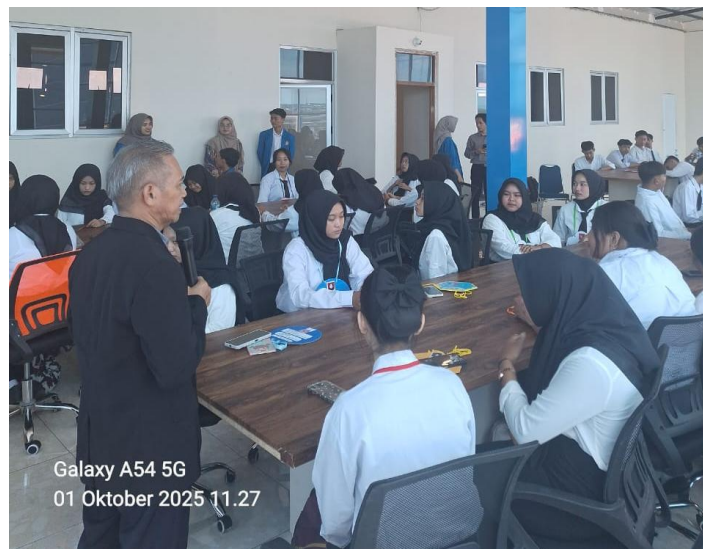
Gambar 3. Evaluasi Kegiatan

Temuan hasil pelaksanaan kegiatan menunjukkan bahwa pelatihan wirausaha berbasis teknologi digital memberikan dampak positif nilai rata-rata dari 62,4 pada pre-test menjadi 80,3 pada post-test, atau meningkat sebesar 17,9 poin (28,7%), terhadap kesiapan mahasiswa dalam mengadopsi kewirausahaan digital. Peningkatan hasil post-test dibandingkan pre-test mengindikasikan bahwa pendekatan pelatihan yang aplikatif dan partisipatif efektif dalam meningkatkan pemahaman mahasiswa. Hal ini menguatkan pandangan bahwa kewirausahaan digital tidak dapat dipahami secara optimal hanya melalui pembelajaran teoretis, melainkan memerlukan pengalaman praktik yang memungkinkan mahasiswa mengaitkan konsep dengan realitas bisnis. Pendekatan berbasis praktik memberikan kesempatan bagi mahasiswa untuk memahami proses bisnis digital secara lebih nyata sehingga pembelajaran menjadi lebih kontekstual dan mudah dipahami.