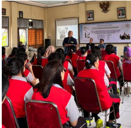
Gambar 2. Pemaparan materi tentang faktor yang berpengaruh terhadap perilaku seksual berisiko