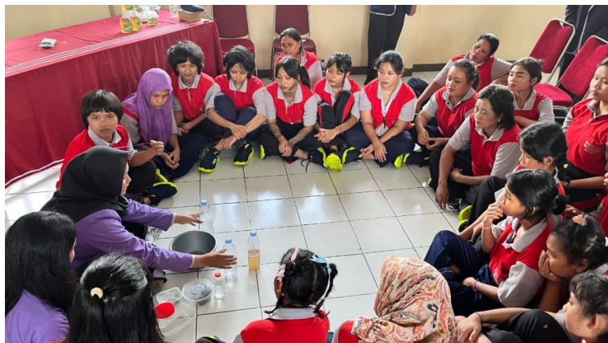
Gambar 1. Keterlibatan peserta dalam salah satu kelompok pembuatan produk

Sedangkan indikator proses kedua dilihat pada sesi praktik pembuatan sabun dari bahan herbal. Pada proses tersebut, tampak seluruh peserta terlibat dalam pembuatan sabun dengan pendampingan tim mahasiswa. Dari seluruh kelompok yang terlibat dalam pembuatan sabun, dihasilkan sabun sesuai dengan sampel yang menjadi standar produk.