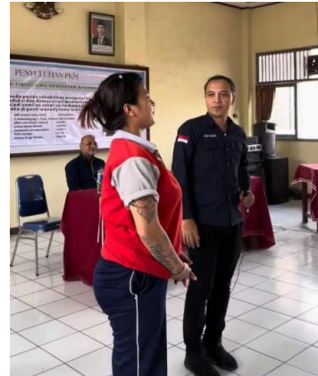
Gambar 3. Salah satu peserta mengajukan pertanyaan usai pemaparan materi

Reaksi terhadap penyelenggaraan kegiatan pengabdian juga menunjukkan kategori kepuasan yang sangat tinggi. Berdasarkan angket kepuasan yang dibagikan kepada seluruh peserta ditambah 18 pihak pengelola panti sosial, diperoleh rata-rata indeks kepuasan sebesar 4,73 (skala 1 – 5). Hal ini menunjukkan bahwa peserta memberikan penilaian yang sangat positif terhadap pelaksanaan kegiatan pengabdian. Pengukuran kepuasan ini mendukung efektivitas sebuah pembelajar, sebagaimana dibuktikan dalam penelitian pada sebuah kegiatan pelatihan, dimana diperoleh indeks kepuasan yang tinggi, serta kenaikan rata-rata pre-test dan post test peserta (Mantin et al., 2022)