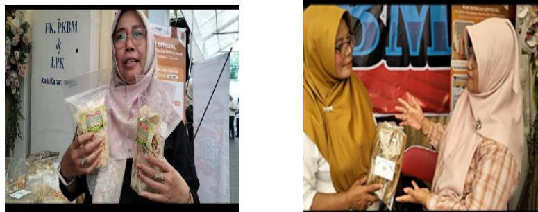
Gambar 3. Kegiatan terkait aspek Afektif

Hasil menunjukkan skor rata-rata 4,25 (kategori tinggi) , yang mengindikasikan adanya peningkatan sikap positif terhadap aktivitas kewirausahaan. Dari sisi afektif, peningkatan kepercayaan diri dan motivasi berwirausaha menunjukkan adanya perubahan sikap dan pola pikir peserta. Peserta tidak lagi hanya berperan sebagai produsen, tetapi mulai memiliki orientasi pasar dan keberanian dalam berinteraksi dengan konsumen. Perubahan ini menjadi indikator penting dalam keberhasilan program pemberdayaan masyarakat