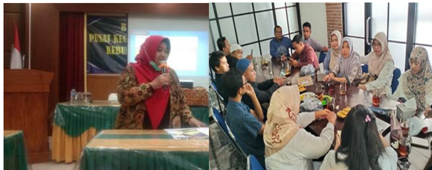
Gambar 1 kegiatan terkait aspek kognitif

dan praktik. Hal ini sejalan dengan teori experiential learning yang menyatakan bahwa pengetahuan akan lebih bermakna yang diperoleh melalui pengalaman langsung (Kolb, 2015). Dalam konteks ini, pameran produk berfungsi sebagai media belajar yang memungkinkan peserta memahami dinamika pasar secara nyata.