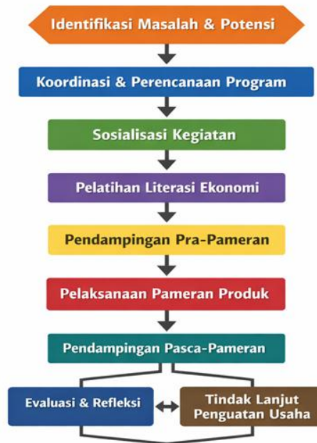
Bagan 1. Kerangka Pemecahan Masalah

Implementasi Pendampingan Terpadu dalam Penyelenggaraan Pameran Produk Warga Binaan PKBM Kabupaten Karanganyar