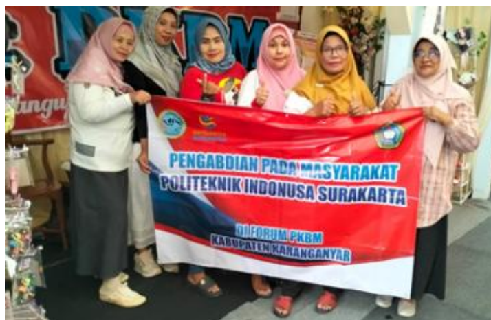
Gambar 5. Kegiatan pengabdian di Forum PKBM Kabupaten Karanganyar

menciptakan siklus pembelajaran yang utuh dan berkelanjutan. Dari perspektif kelembagaan, kegiatan ini juga memperkuat peran PKBM sebagai pusat pemberdayaan ekonomi masyarakat. PKBM tidak hanya berfungsi sebagai lembaga pendidikan nonformal, tetapi juga sebagai agen penguatan kapasitas ekonomi dan penghubung antara masyarakat dengan realitas pasar. Dengan demikian, hasil pengabdian ini menunjukkan bahwa model pendampingan terpadu berbasis experiential learning tidak hanya mampu meningkatkan literasi ekonomi, tetapi juga memberikan dampak nyata terhadap perubahan perilaku, pola pikir, dan kemandirian ekonomi warga binaan. Hal ini menegaskan bahwa tujuan pengabdian telah tercapai secara optimal