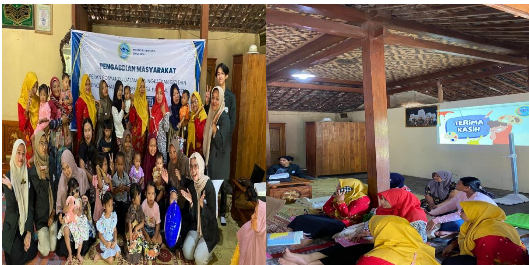
Gambar 1. Proses Kegiatan Edukasi

Materi disampaikan melalui ceramah interaktif yang menggunakan PowerPoint dan leaflet edukatif. Peserta diberikan kesempatan bertanya dan berdiskusi aktif. Banyak peserta yang menanyakan tentang contoh menu seimbang untuk balita, cara mengolah makanan bergizi dengan biaya terjangkau, serta bagaimana mengenali tanda-tanda awal stunting. Setelah sesi materi, kegiatan dilanjutkan dengan posttest untuk mengetahui peningkatan pengetahuan peserta setelah kegiatan edukasi berlangsung.