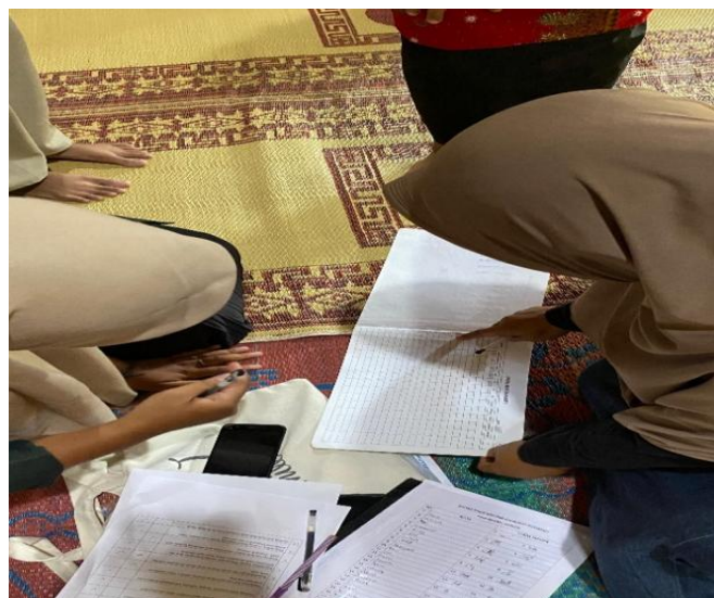
Gambar 2. Proses Pengisian Kuesioner