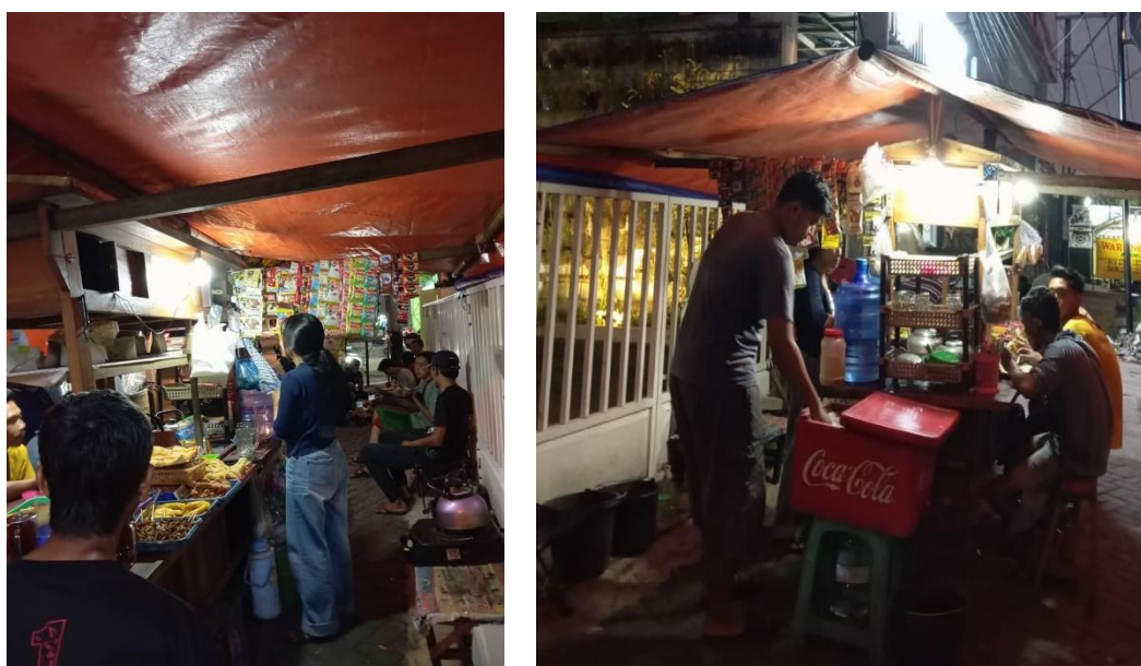
Gambar 2. Tempat Usaha Wedangan Selaras

Pada saat evaluasi pendampingan adalah yang dilakukan tim pengabdian setelah pemberian materi adalah komunikasi secara intens dengan pemilik usaha, setelah itu dilakukan evaluasi yaitu beberapa hal yang sudah diterapkan adalah dengan melakukan pencatatan secara rutin dengan memiliki kas harian, kas harian yang digunakan dengan menggunakan pencatatan manual pada buku catatan mengingat kesibukan yang digunakan keseharian dalam mengelola wedangan selaras, Selanjutnya adalah membuat alokasi perencanaan keuangan pola yang ingin diterapkan adalah 75 persen untuk modal kerja, 15 persen pengembangan usaha, sedangkan 10 persen digunakan untuk dana darurat. Ini merupakan langkah awal yang dilakukan untuk keberlanjutan usaha yang dijalankan.