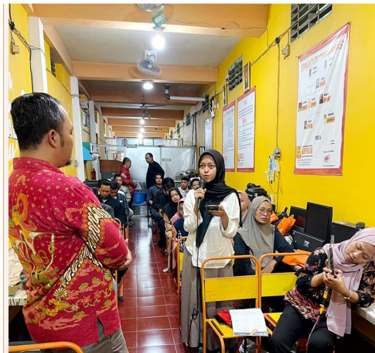
Gambar 3. Diskusi dan Pendampingan Remaja

Salah satu poin penting dalam diskusi kelompok adalah bagaimana AI tetap harus dikontrol penggunaannya agar tidak menimbulkan ketergantungan atau dampak negatif lainnya. Remaja diajak untuk bersikap kritis dan bijak dalam menggunakan teknologi. Seperti disampaikan oleh narasumber D3 Farmasi Politeknik Indonusa Surakarta “Teknologi adalah alat, bukan tujuan. Remaja perlu diajari untuk menggunakan AI sebagai pendukung, bukan sebagai pengganti peran manusia dalam berpikir dan mengambil Keputusan (Lase, 2019).” Acara terakhir adalah melakukan acara penutupan kepada peserta penyuluhan dan dilanjutkan dengan sesi foto bersama dengan peserta penyuluhan. Hasil evaluasi yang dilakukan melalui pre-test dan post-test menunjukkan adanya peningkatan pemahaman peserta terhadap tiga aspek utama: (1) pentingnya karakter kuat dalam kehidupan pribadi dan profesional, (2) kesehatan mental sebagai pondasi keberhasilan jangka panjang, dan (3) peran AI sebagai alat bantu dalam merencanakan masa depan. Rata-rata skor pengetahuan peserta meningkat sebesar 42% setelah kegiatan, menunjukkan efektivitas pendekatan edukatif berbasis teknologi ini