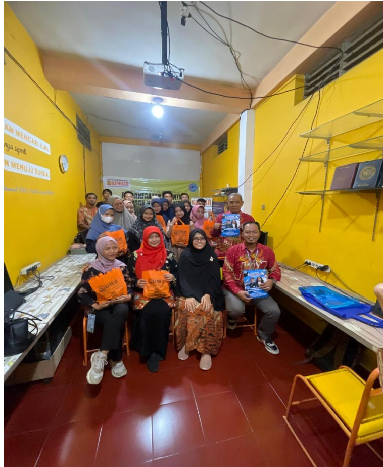
Gambar 4. Foto Bersama Dengan Remaja