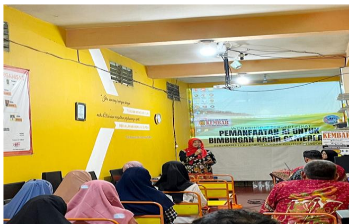
Gambar 1. Motivasi dari Kepala Dinas Perindustrian dan Tenaga Kerja Kabupaten Klaten

Kegiatan awal yang dilakukan adalah persiapan agar kegiatan dilaksanakan dapat berjalan dengan lancar. Dalam penyuluhan Pengembangan AI Dalam Pembangaunan Karakter Dan Kesehatan Mental Menuju Karier Cemerlang ini dilakukan dengan mempersiapkan seluruh keperluan kegiatan penyuluhan. Hal-hal yang dipersiapkan diantaranya menentukan dimana acara akan digelar, perencanaan acara kegiatan, perencanaan anggaran yang diperlukan, perencanaan keperluan-keperluan kegiatan, survei tempat, perencanaan konsumsi dan kehumasan. Selain perlengkapan yang tepat juga harus mencatat semua yang diperlukan saat acara berlangsung. Materi yang disampaikan bagi masyarakat dibuat dengan sebaik mungkin agar tidak monoton. Kegiatan sosialisasi ini dilaksanakan oleh Program D3 Farmasi Politeknik Indonusa Surakarta bekerja sama dengan LKP Kembar Klaten dan Dinas Perindustrian dan Tenaga Kerja Kabupaten Klaten. Acara ini berlangsung selama satu hari dan diikuti oleh 45 remaja dari berbagai SMA/SMK, Perguruan Tinggi dan Para Pencari Kerja dengan mengikuti program pelatihan berbasis teknologi. Kegiatan ini bertujuan untuk memperkenalkan peran Artificial Intelligence (AI) dalam membantu remaja mengembangkan karakter positif, menjaga kesehatan mental, dan menyusun rencana karier yang terarah (Sari, 2017).