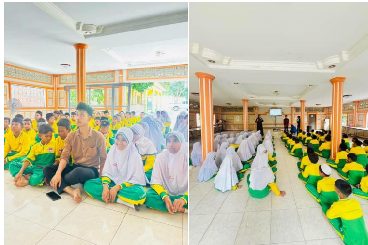
Gambar 2. Peserta dari kegiatan webinar

Pada sesi diskusi, kegiatan dilakukan dalam bentuk tanya jawab interaktif. Peserta diberi kesempatan menyampaikan pengalaman maupun kendala dalam penggunaan layanan keuangan digital, kemudian narasumber memberikan penjelasan dan solusi secara langsung.