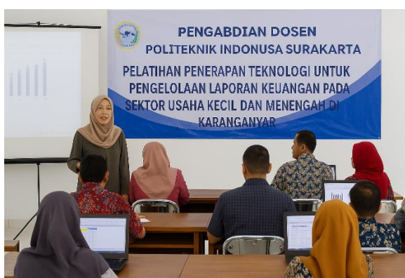
Gambar 2. Pelatihan Teknologi Untuk UMKM

Program pengabdian masyarakat ini dilaksanakan dengan tujuan utama untuk meningkatkan kompetensi pelaku usaha kecil dan menengah (UKM) di Kabupaten Karanganyar dalam mengelola laporan keuangan berbasis teknologi digital. Dalam era tranformasi digital saat ini, pengelolaan keuangan yang efektif dan efisiensi menjadi kunci penting dalam keberlangsungan dan pengembangan usaha (Wahyudiono, 2024). Oleh karena itu, program ini dirancang untuk membekali para pelaku usaha kecil dan menengah (UKM) dengan pengetahuan dan ketrampilan praktik dalam menggunakan aplikasi digital untuk pencatatan transaksi, pengelolaan arus kas, serta penyusunan laporan keuangan.