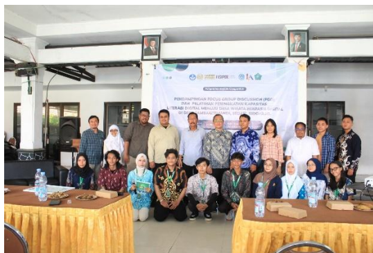
Gambar 1. Foto Bersama Perangkat Desa Tambak Cemandi