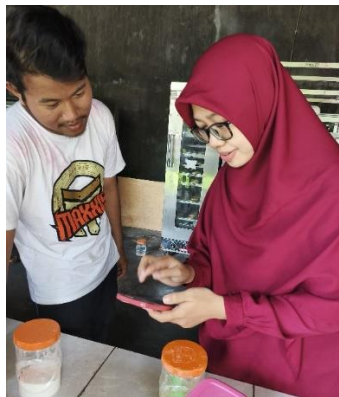
Gambar 5. Pelatihan pembuatan kartu persediaan

Kolom jumlah diatur menggunakan format keuangan tanpa desimal dibelakangnya, kemudian diisi dengan rumus kuantitas dikali dengan harga per satuan.