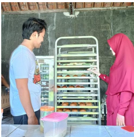
Gambar 3. Penyampaian materi kartu persediaan

Pelaksanaan kegiatan pengabdian dilanjutkan dengan memberikan materi praktik pembuatan template kartu persediaan menggunakan Spreadsheet (Alfanny & Nur, 2025). Pertimbangan tim pengabdian menggunakan Spreadsheet adalah pertama, karena latar belakang pendidikan dari pemilik UMKM yang merupakan seorang mahasiswa sehingga dapat dipastikan pemilik dapat mengoperasikan Spreadsheet dengan baik. Kedua, karena spreadsheet dapat dibuka melalui device apapun baik handphone , laptop, tab dan lain-lain dan dapat dibuka dimana saja kapan saja (Handajani et al., 2024) . Ketiga, karena spreadsheet menyimpan data yang diketik secara otomatis tanpa harus klik save sehingga jika lupa menyimpan maka akan tersimpan dengan sendirinya. Keempat, dengan menggunakan spreadsheet akan dapat dicari informasi lebih detail dengan pivot .