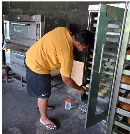
Gambar 2. Kegiatan Produksi

Pelaksanaan kegiatan pengabdian diawali dengan penyampaian materi mengenai pengantar pencatatan persediaan oleh tim pengabdian (Saputra et al. , 2025). Materi yang disampaikan antara lain pentingnya mencatat bahan baku dan bahan lainnya secara detail, kelebihan dan kekurangan membuat kartu persediaan. Bahan baku dan bahan lainnya perlu dicatat dengan jelas dan lengkap agar pemilik UMKM dapat mengetahui kapan pembelian bahan, jumlah yang dibeli, kapan bahan dimasukkan produksi sampai jumlah sisa bahan setelah produksi. Kelebihan pemilik UMKM jika mencatat bahan pada kartu persediaan antara lain agar pemilik tau kapan bahan akan kadaluarsa, pemilik dapat menentukan harga pokok produk. Pemilik dapat mengatur jumlah stok bahan di ruang penyimpanan agar tidak terjadi stok kekurangan atau stok berlebihan. Kekurangan menggunakan pencatatan kartu persediaan adalah jika pemilik tidak bias melakukan pencatatan secara konsisten, maka kartu persediaan akan percuma dan kelebihan pencatatan kartu persediaan tidak dapat dirasakan dengan baik.